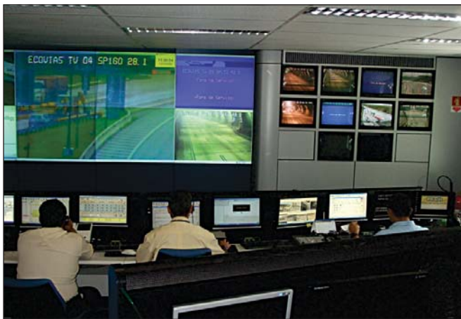
Figura 3: Central de monitoramento

5.10.4 A central de monitoramento (controladora) do sistema de circuito interno de TV deve ter vigilância habilitada durante todo o período de funcionamento diário do túnel.