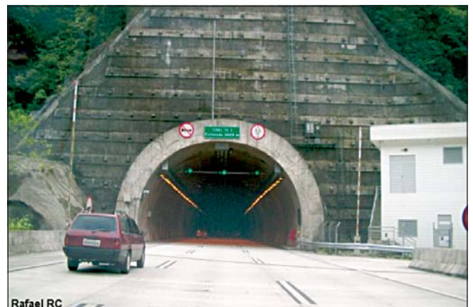
Figura 2: Sinalização na entrada do túnel